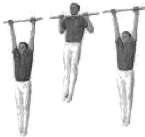
Рис. 2. Подтягивание на перекладине.